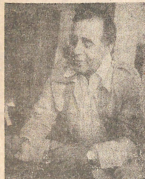
Jean Ziegler, sociólogo e militante anti-imperialista de visita à República Popular de Moçambique

Professor de Sociologia na Universidade de Genebra, Conselheiro Nacional e deputado do