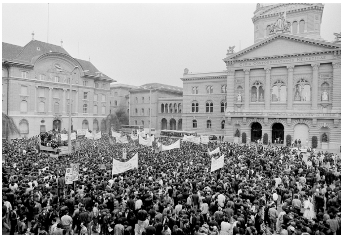
Albanerinnen und Albaner demonstrieren am 4. Mai 1991 auf dem Bundesplatz in Bern gegen die Missachtung der Minderheitenrechte und die serbische Repressionspolitik in Kosovo, dodis.ch/60351 (CH-SNM LM-179459.2).

verfahren erledigt. 20 Nicht behandelt werden zur Zeit nur die Asylgesuche von Deserteuren und Refraktären. Bei negativem Ausgang des Asylverfahrens wird die Wegweisung verfügt, und der gegenwärtigen Situation wird dadurch Rechnung getragen, dass eine grosszügige Ausreisefrist angesetzt wird. Diese wird ab dem 15. Oktober 1991 auslaufen. Sollten die Bestrebungen, einen effektiven Waffenstillstand herbeizubringen, gelingen und die Situation sich beruhigen, heisst dies, dass ab diesem Datum vermehrt Wegweisungen vollzogen werden. Heute wird nur in Missbrauchsfällen und bei strafrechtlichen Vorgängen vollzogen. Im weiteren würde betreffend neu einreisender Asylbewerber am Individualverfahren festgehalten.