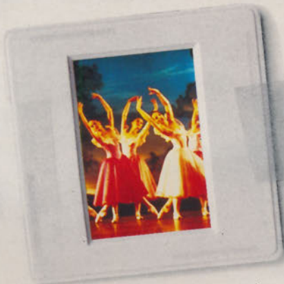
Ballett mit Welt-niveau - sensationell choreografiert.

Keine Angst – auch unsere Städter wissen, was sich für ein gastliches Land gehört! Ein bisschen vorwarnen aber möchten wir Sie schon. Denn sobald Sie bei uns eintreffen, könnten Sie immerhin vom Festfieber angesteckt werden... Neben 700 regionalen und 1991 spontanen Anlässen lässt unser Jubiläumsprogramm nämlich nichts zu wünschen übrig: Ein Fest der vier Kulturen in der französischen Schweiz, eine 700-Jahr-Feier in der Zentralschweiz, ein Fest der Solidarität im Bergkanton Graubünden – Ihre Entdeckungsreise kann beginnen! Denn wir verwandeln ganze Seen in bezaubernde Lichtermeere, Luftschlösser in Kulturpaläste, Dorf- in Festplätze und Städte in Varietés.