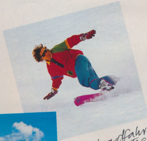
Snowboardfahren - nach zwei Tagen hatte der Junior den "Dreier" raus.