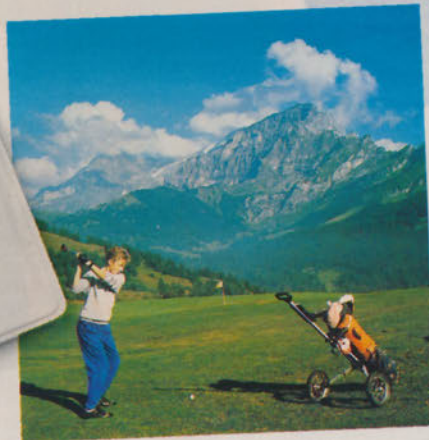
Highlife in den Bergen. Ein gutes Dutzend Plätze laden ein zum Golfen. Mein Eisstand: 3 Löcher auf 122 Stöße.