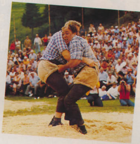
Sowas - Schwingerkönige in einer 700 Jahre alten Demokratie.

Dinge aufzubauschen ist eigentlich nicht unsere Art, aber für Gäste, die das Tun nicht lassen können, erfinden wir gerne immer wieder etwas Besonderes. Alpensurfen auf 1800 Metern über Meer, zum Beispiel. Oder Ruderpartien auf unterirdischen Seen. Aber wenn Sie persönliche Rekorde gerne auf später verschieben möchten, ist das kein Problem! Sportliches Zuschauen bei typisch Schweizerischem gibt auch ganz schön zu tun: etwa beim Schwingen (Wrestling nach Schweizer Art), Hornussen, Boccia, Armbrustschiessen – oder ganz einfach, wenn's auf einer Älplerchilbi hoch hergeht.