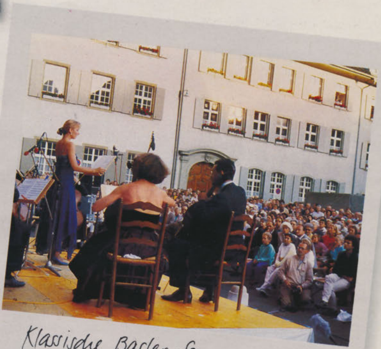
Klassische Basler Sommermusik. Open-air mit Starbesetzung.