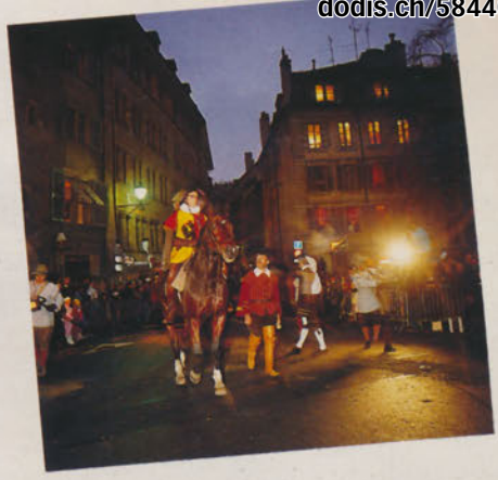
Defilée by night: festliche Besichtigung - lektionen an der Gruener Escalade.