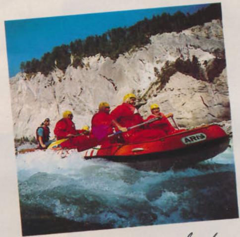
Wasserratten haben Glück. River-Rafting ist "in".