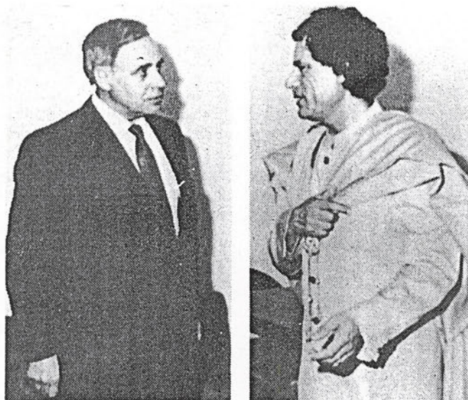
Jean Ziegler (l.) zu Besuch bei Libyens starkem Mann Kathafi