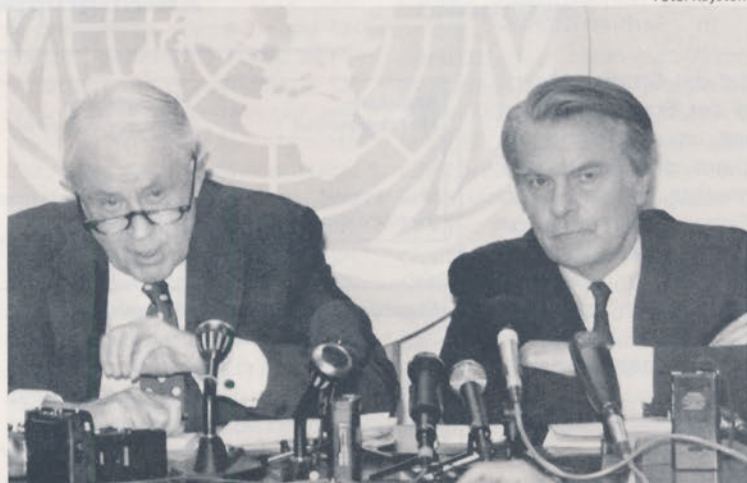
Cyrrhus Vance (links) und Lord David Owen, die beiden Kopräsidenten der Internationalen Konferenz über das frühere Jugoslawien in Genf.

Cyrrhus Vance (à gauche) et Lord David Owen, les deux coprésidents de la Confédération internationale sur l'ancienne Yougoslavie à Genève.