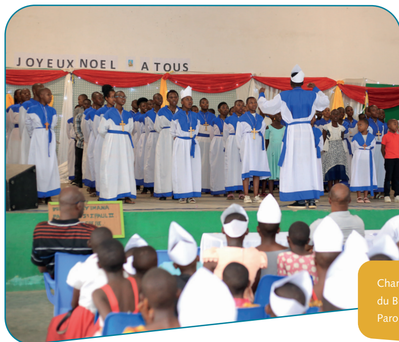
Chanteurs à l'étoile du Burundi, Paroisse de Buterere

Un exemple de communiqué de presse et le formulaire « Droit à l'image » sont disponibles sur www.missio.ch .