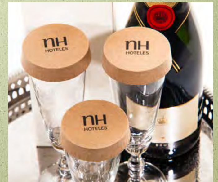
Couvercles pour verres / caps